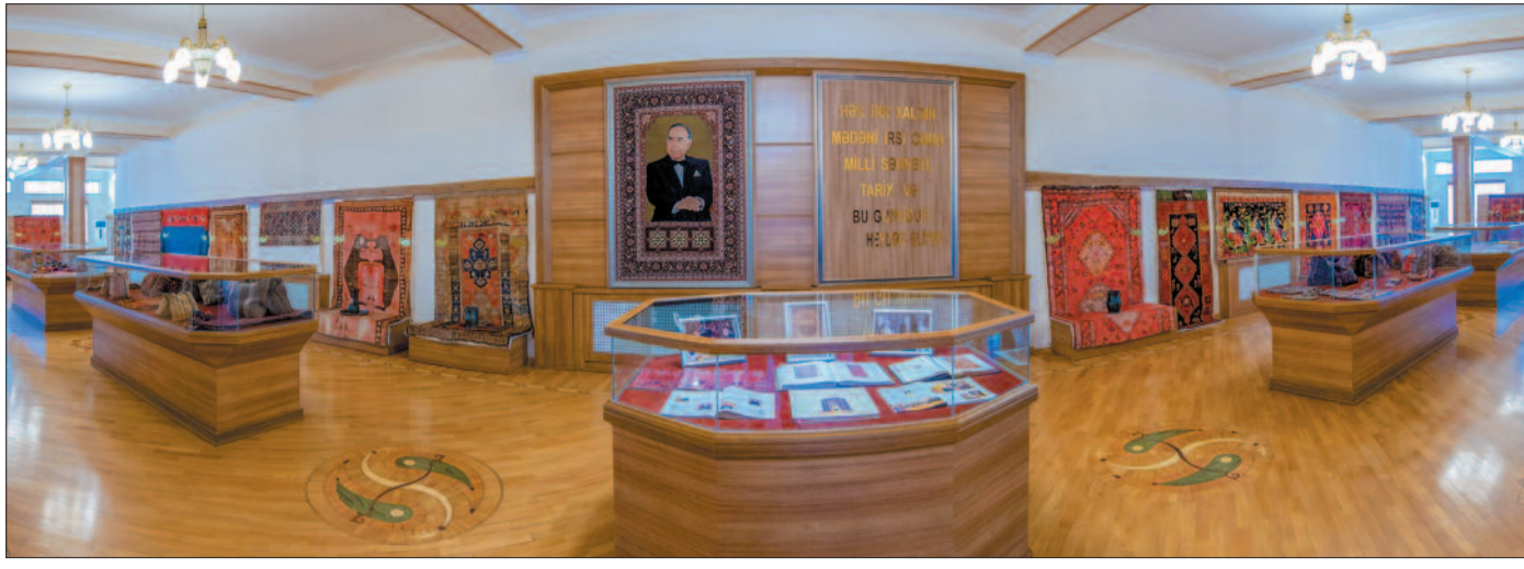
5 may "Xalçaçı günü"dür

Azərbaycan Respublikasının Prezidenti cənab İlham Əliyev qədim el sənəti olan xalçaçılığın inkişafına xüsusi diqqət yetirir. Təsədüfi deyil ki, Azərbaycan xalçaları YUNESKO-nun qeyri-maddi mədəni irsi siyahısına daxil edilmişdir. "Azərbaycan xalça sənətinin qorunması və inkişaf etdirilməsi haqqında" Azərbaycan Respublikasının Qanununun qəbul olunması da bu sənətə dövlət səviyyəsində göstərilən diqqətin ifadəsidir. Bu gün ölkəmizdə xalçaçılıq sənətinin tarixi-mədəni dəyəri ilə yanaşı, onun iqtisadi əhəmiyyəti də yüksək qiymətləndirilir, şəhər və rayonlarımızda xalça istehsalı emalatxanaları istifadəyə verilir. Bu da yeni iş yerlərinin açılması və xalçaçılıq sənəti ilə bağlı xammal istehsalı sahələrinin inkişafına təkan verir. Ölkə Prezidenti cənab İlham Əliyevin 2018-ci il 15 fevral tarixli "Naxçıvan şəhərində xalça istehsalı emalatxanasının tikintisi, təchizatı və infrastrukturunun yaradılması ilə bağlı tədbirlər haqqında" Sərəncamı da